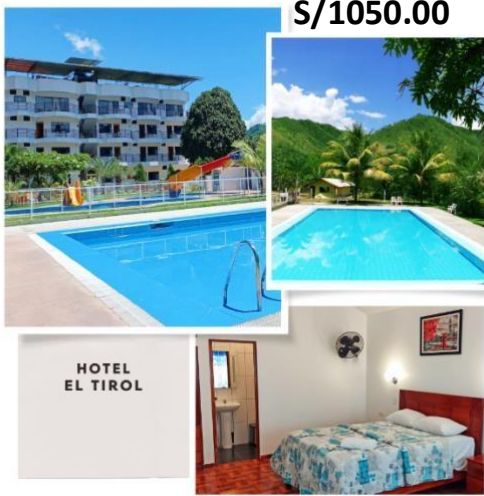
HOTEL EL TIROL