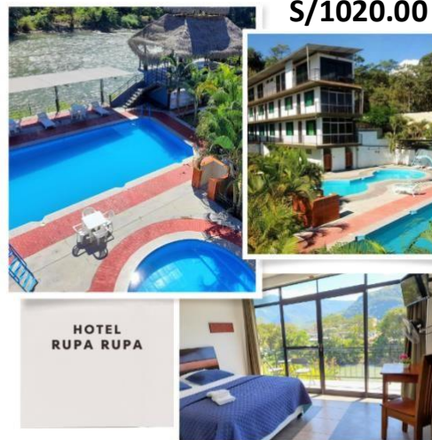
HOTEL RUPA RUPA